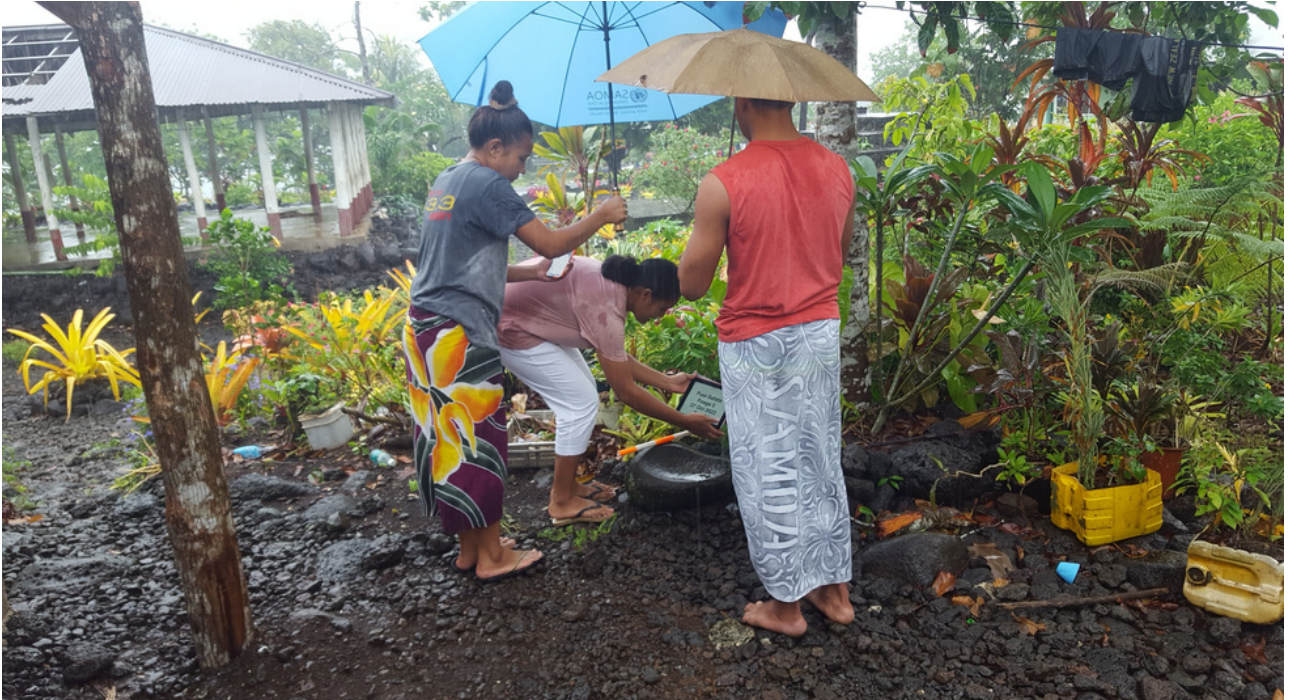
Saute i sisifo o Fusi-Safata oloo maua ai le foaga 5. Faatinoga suesuega vaega suesue mo Foaga Tupou Fiu, Sala Faasavalu ma Tuiala Moimoi.