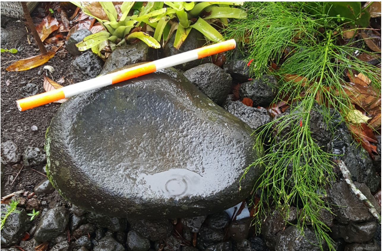
Foliga vaia foaga 5, Fusi-Safata.