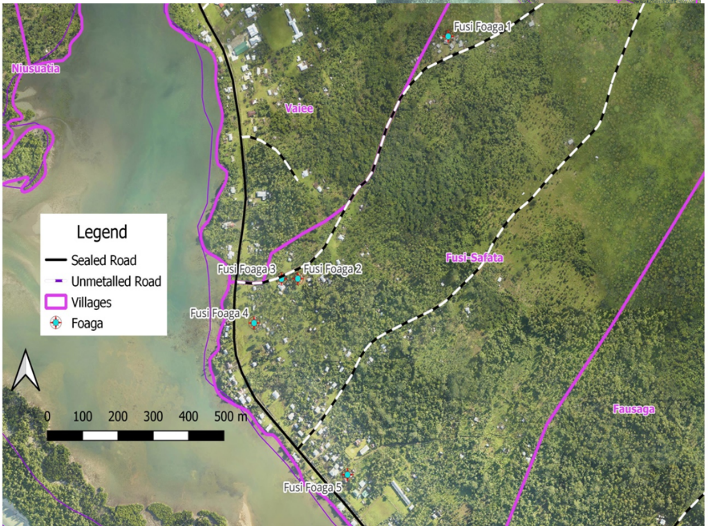
Faafanua o Foaga Fusi-Safata, Oketopa 27, 2022